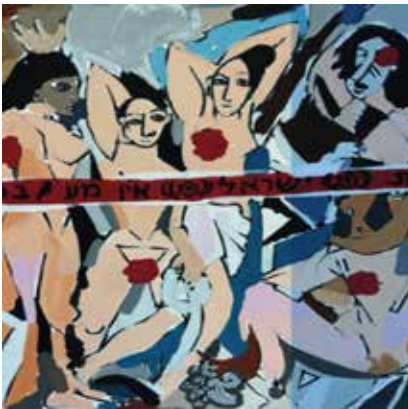
"As Filhas de Be'eri" Tributo a Les Demoiselles d'Avignon

Criadora de várias obras sobre as atrocidades do 7 de outubro de 2023, Keren inspirou-se em um trabalho de Marc Chagall, “Au-dessus de la ville” e a partir deste criou a “Au-dessus de la ville rouge” incluindo elementos como manchas vermelhas, numa referência ao sangue das vítimas do terror, e uma tarja comum nas cenas de crimes na qual escreve em hebraico “Proibido Passar”. Keren inspirou-se também em Picasso para mais um trabalho. A partir da obra “Les demoiselles d’Avignon”, criou “As Filhas de Be’eri”.