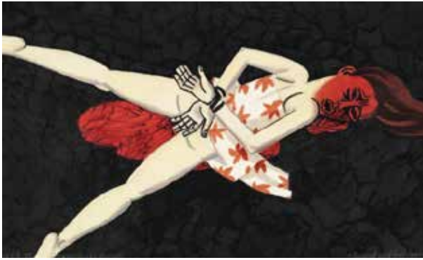
"Vítima de estupro"