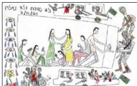
"Não vamos esquecer e não vamos perdoar"