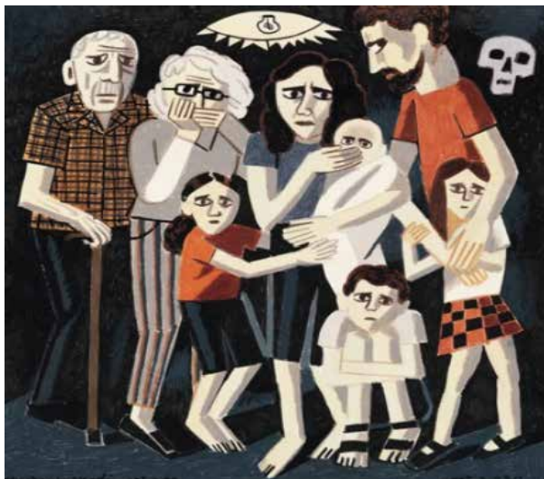
"Família se escondendo"