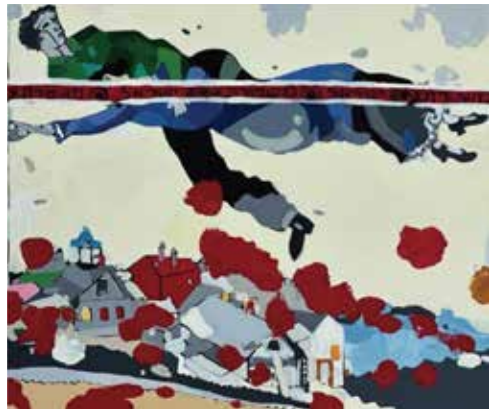
"Au-dessus de la ville rouge" Tribute a Chagall