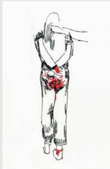
“Traga-a para casa”