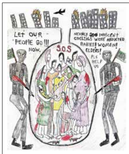
"Deixe nosso pessoal ir agora!"

Desenhista, escultor e produtor de vídeos, como muitos desde 7 de outubro, duvida de tudo o que pensava e sabia. Como parte de sua luta pessoal, ele decidiu que iria "desenhá-la" e carregá-la na web todos os dias. Suas ilustrações aparentemente ingênuas são baseadas em imagens da guerra e chamam a atenção tanto para seus heróis quanto para os responsáveis. Ativista pacifista, os acontecimentos de 7 de outubro chocaram-no e surpreenderam-no. Fizeram-no reavaliar e repensar muitas coisas que achava que sabia e das quais tinha certeza. "Não pude evitar e assisti aos vídeos horríveis que surgiram de todos os lados. Senti que estava sendo preenchido por sentimentos tempestuosos de raiva, raiva, desespero e desamparo".