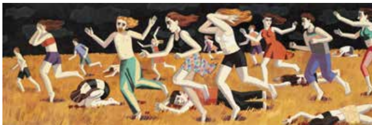
“Fugindo do Festival “Nova Music”

As imagens horríveis de 7 de outubro de 2023 estão na mente dela o tempo todo. Como artista, a melhor maneira de lidar com o seu trauma, bem como com o trauma coletivo de todos os israelenses, tem sido criar arte e partilhá-la com o mundo. O resultado são trabalhos urgentes, assustadores e comoventes no papel. Disse ela: “Acho que neste momento é muito importante conscientizar o mundo sobre o que está acontecendo. Às vezes as pessoas justificam automaticamente tudo o que vem da Palestina. Nem sequer compreendem a diferença entre a Palestina e o Hamas, ou entre a Faixa de Gaza e a Cisjordânia. Eles apoiam automaticamente a Palestina... Essa situação agora é muito diferente, então é muito importante para mim tentar explicar do meu jeito, do jeito que eu consigo fazer”. Desde 7 de outubro o ataque terrorista do Hamas tem sido tema recorrente em suas obras. Está com uma exposição em cartaz no museu judaico de NY.